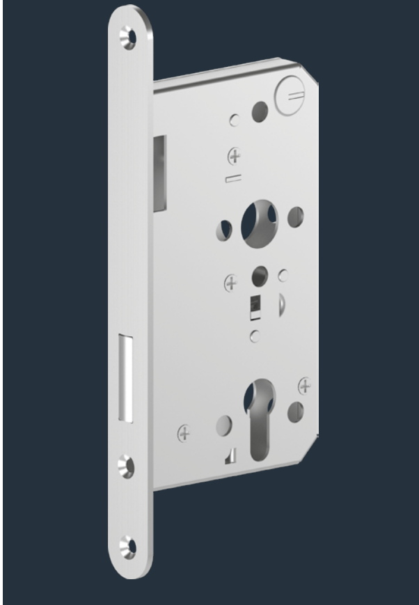
GBS 108 (81 RI)